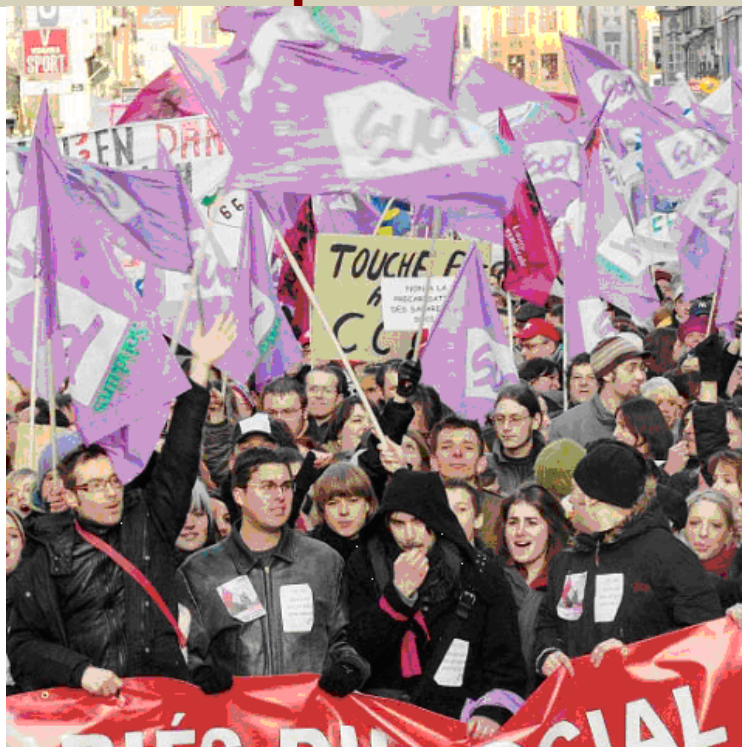
cortège du social le 29 mars